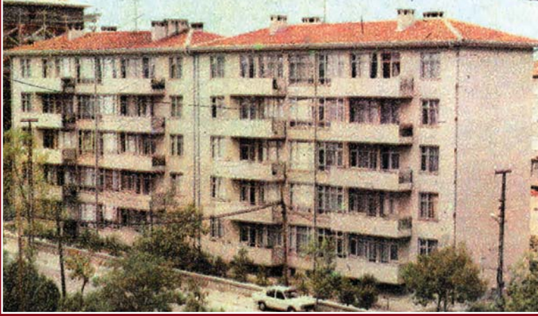
Edirne Keşan Garnizon 1978-1979