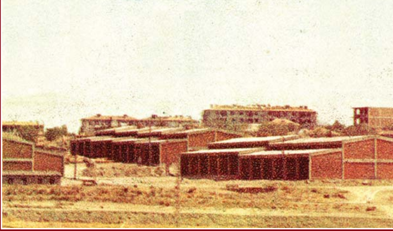
Edirne Keşan Er Pavyonu, Servis Binası ve 2 Adet Yemekhane 1979-1980